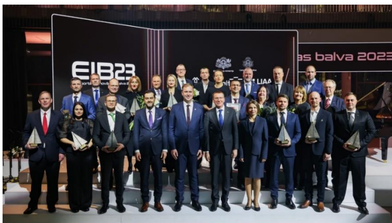
"Eksporta un inovācijas balvas 2023" pasniegšanas ceremonijā

Konkursā, saskaņā ar nolikumu, balvas tika piešķirtas kategorijās "Eksporta čempions", "Inovācijas čempions", "Eksporta jaunpienācējs", "Eksporta pieauguma līderis" un "Eksportspējīgākais jaunais tūrisma produkts". Uzvarētāji tika noteikti, žūrijas komisijai izvērtējot Centrālās statistikas pārvaldes datus par uzņēmumu un tā eksportu, radīto pievienoto vērtību, rentabilitāti, nodarbināto skaitu un citiem rādītājiem.